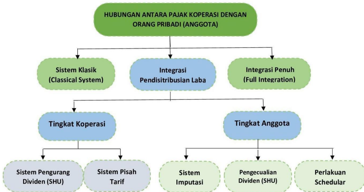
Gambar I.1. Konsep Hubungan Pajak Koperasi dengan Orang Pribadi

Sumber: B. Bawono Kristiaji, "Prospek Pemajakan dan Retained Earnings," dengan penyesuaian oleh penulis sebagaimana dikutip dari Sijbren Cnossen, "What kind of corporation tax?" (Perrymead, Bath: Fiscal Publications), 1993 dan Peter Hariss, "Corporate Tax Law: Structure, Policy and Practice," (Cambridge: Cambridge University Press), 2013.