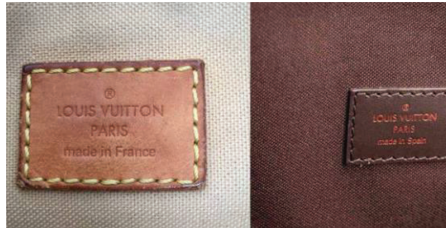
Gambar 2. 4 Stempel Tulisan Louis Vuitton