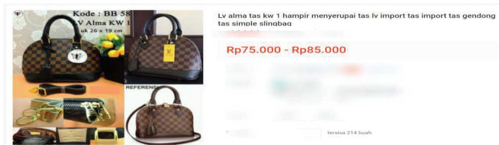
Gambar 2.3 Louis Vuitton Alma Tas Kw 1 59

Mengenai barang dengan merek Louis Vuitton (LV), iPrice Indonesia sebagai situs platform perbandingan harga terpercaya mengklaim bahwa harga tas Louis Vuitton (Lv) Alma Bb Damier Ori adalah Rp. 17.900.000,-. 60 Harga ini berbeda dengan harga produk yang mengandung kata “Kw” yang tercantum dalam gambar 2.3. Selain itu, gambar 2.3 menunjukkan kode tas LV yaitu BB 58 dengan tingkat kw level 1. Adapun cara yang perlu diketahui untuk membedakan produk asli dan palsu terhadap tas merek LV, antara lain: 61 Pertama , Logo Tas LV. Ahli tas mewah Effi Rahmanto mengatakan bahwa monogram atau logo LV yang asli berwarna coklat dan dibuat oleh pengrajin profesional. Kedua , Tas LV asli dijahit dengan tangan yang menggunakan benang resin khusus agar memiliki kualitas daya tahan ekstra. Selain itu, tas LV dengan motif memiliki sambungan dua arah antara bagian potongan harus sama. Ketiga , bentuk font, spasi dan kualitas stempel. Berdasarkan gambar 2.4 menunjukkan stempel dapat dilihat pada tas LV yang asli. Pengguna harus memastikan bahwa jarak antara L dan O tidak terlalu besar. Selain itu, bentuk huruf O adalah bulat. Keempat , Kode Seri Tas LV. Kode seri yang tertera pada gambar 2.5 merupakan sistem pengkodean tanggal eksklusif yang digunakan sebagai informasi untuk mengetahui identitas dan lokasi produk tas LV dibuat. Kode tersebut mulai diberlakukan sejak 1980-an. 62