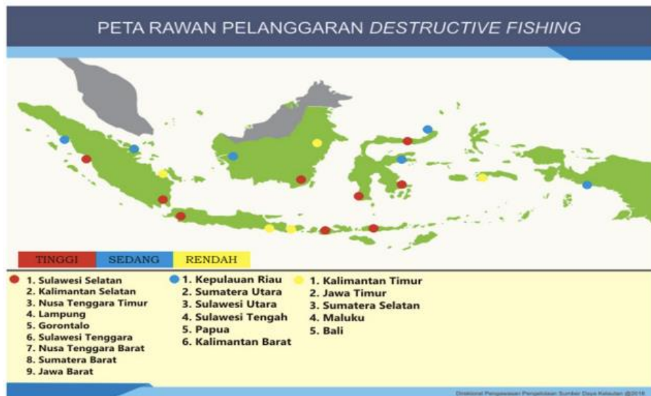
Gambar Peta 2.1.1 Persebaran Wilayah Rawan Pelanggaran Destructive Fishing

Berikut peta persebaran destructive fishing, yang di dalamnya termasuk tindak pidana pengeboman ikan. 18