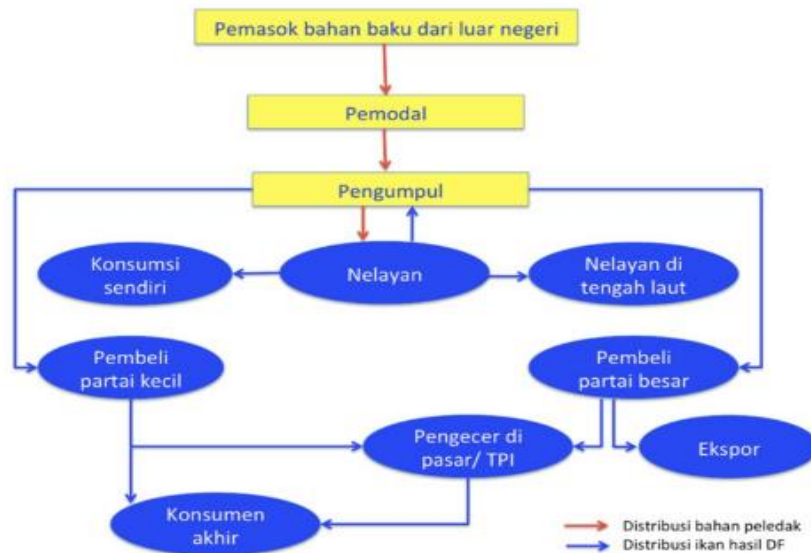
Bagan 3.3.1 Skema pendistribusian bahan peledak yang digunakan nelayan untuk melakukan pengeboman ikan.

Jika dilihat dari bagan tersebut, jelas nelayan hanyalah pelaku lapangan atas tindak pidana pengeboman ikan. Sedangkan aktor pentingnya adalah pengumpul, pemodal dan pemasok bahan baku dari luar negeri yang terlibat dalam pendistribusian bahan peledak. Namun, aktor-aktor penting ini belum dapat disentuh oleh undang-undang perikanan. Malahan, dalam kasus-kasus yang dapat dilihat dari putusan-putusan pengeboman ikan yang telah dikumpulkan oleh penulis, undang-undang perikanan menjadi alat yang membuat nelayan kecil yang melakukan tindak pidana pengeboman ikan sebagai pelaku tunggal. Fakta ini juga disampaikan oleh Karman Sastro, Parid Ridwanuddin dan Marthin Hadiwinata. Mereka sebagai orang-orang yang banyak terlibat dalam permasalahan perikanan, belum melihat adanya tindakan tegas bagi pengumpul, pemodal dan pemasok bahan peledak yang digunakan oleh nelayan kecil untuk melakukan tindak pidana pengeboman ikan. Hal ini membuktikan bahwa tujuan pembentukan undang-undang perikanan, yang salah satunya mengarah pada keberpihakan terhadap nelayan kecil tidak dilaksanakan sebagaimana mestinya.