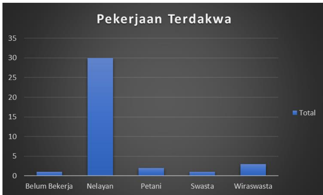
Diagram 2.3.1 Pekerjaan Terdakwa dari 37 Kasus Pengeboman Ikan

Dari diagram di atas, nelayan mendominasi pekerjaan terdakwa yaitu 30 orang. Sebagian kecil lainnya adalah petani 2 orang, wiraswasta 3 orang, pekerja swasta dan belum bekerja masing-masing 1 orang.