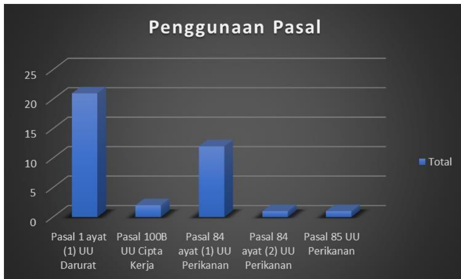
Diagram 2.2.1 Persebaran Penggunaan Pasal dalam Tindak Pidana Pengeboman Ikan.