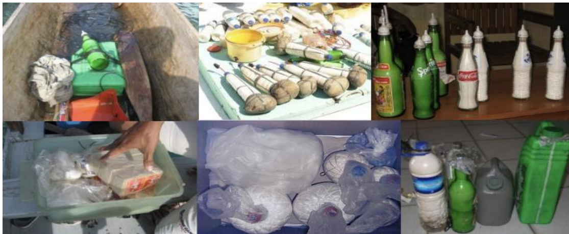
Gambar 3.4.1 Peralatan yang digunakan untuk melakukan penangkapan ikan menggunakan bahan peledak.

Di sisi lain, tindak pidana destructive fishing termasuk pengeboman ikan yang dilakukan oleh nelayan-nelayan kecil merupakan salah satu akibat dari kerusakan ekologi di wilayah perairan Indonesia yang semakin tak terkendali. Hal ini diungkapkan oleh Karman Sastro selaku advokat publik yang sudah banyak menangani kasus-kasus terkait isu perikanan. Beliau juga mengungkapkan bahwa pengembangan industri dan pengembangan kota menjadi penyebab utamanya. Hal tersebut karena pengembangan industri dan pengembangan kota banyak membuat nelayan semakin jauh dari laut. Contohnya seperti kasus salah satu perusahaan di Jawa Tengah, yang menggusur tambak tradisional, bahkan terjadi penutupan sungai yang merupakan akses nelayan untuk pergi ke laut. Kemudian, contoh lainnya adalah pengembangan industri yang terjadi di pinggir-pinggir pantai mengakibatkan pencemaran lingkungan, sehingga sumber daya ikan yang awalnya mudah diakses menjadi semakin jauh ke laut. 77 Nelayan mengalami penurunan hasil tangkap, dan perlu berlayar lebih jauh ke tengah laut untuk mencari ikan. Hal ini membuat modal yang diperlukan pun semakin tinggi, sehingga nelayan terpaksa melakukan cara instan seperti menangkap ikan dengan menggunakan bom ikan agar dapat hasil tangkap yang lebih banyak dan